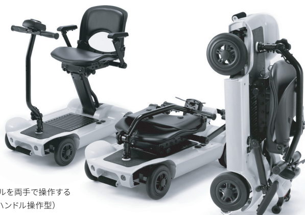
前方のハンドルを両手で操作する SCOO(前方ハンドル操作型)