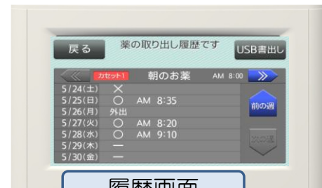
過去4週間まで確認することが可能。 USBにデータを取り出し、PCでも確認出来ます。