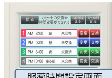
各カートリッジの時間設定を行います。 ※ダブの色はピルケースの色に対応。