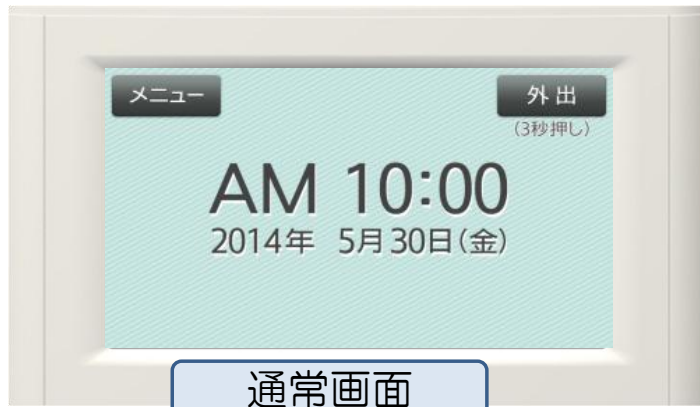
通常画面から2タッチで目的画面に到達。