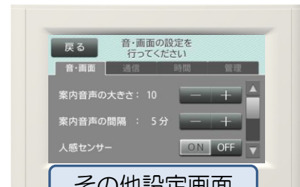
音声の大きさや画面の明るさなどの標準設定を行います。